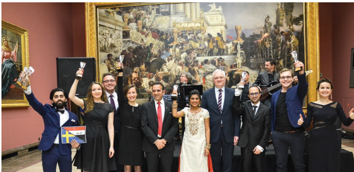
Kraków, luty 2017

Ogłoszona i przeprowadzona zostanie czwarta edycja środowiskowej Nagrody „Gwiazdy umieędzynarodowienia – Internationalization Stars” – wyróżniającej osoby, które w wybitny sposób rozwijają umieędzynarodowienie polskich uczelni. Nagroda przyznawana jest w następujących kategoriach: „Gwiazda Zarządzania – Management Star”; „Gwiazda Kształcenia – Teaching Star”; „Gwiazda Marketingu – Marketing Star”; „Gwiazda Badań – Research Star”; „Gwiazda Publicznej Dyplomacji Akademickiej – Public Diplomacy Star”. Przyznane zostaną także dwie nagrody specjalne: „Wschodząca Gwiazda – Rising Star” i „Wybitna Gwiazda – Distinguished Star”. Gala Nagrody: druga połowa stycznia 2021.