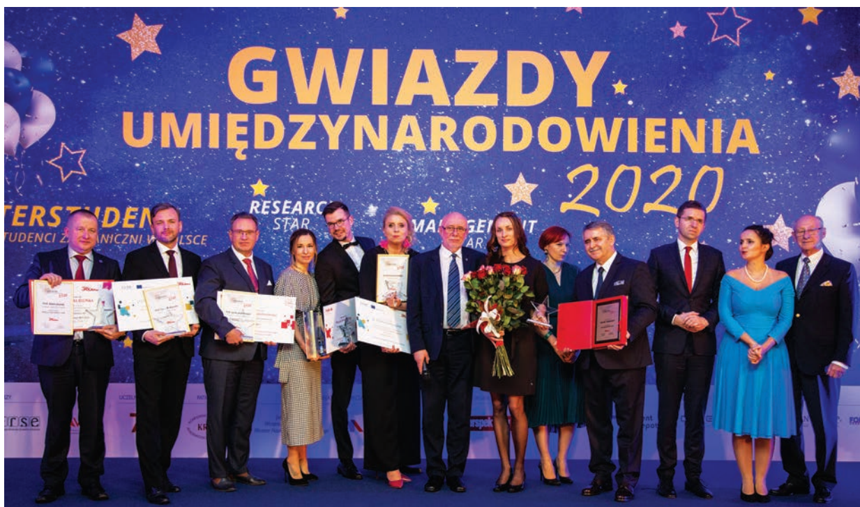
Łódź, styczeń 2020