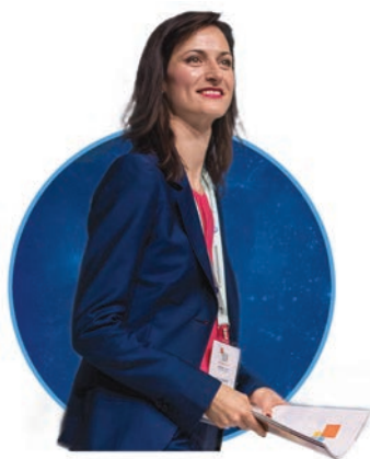
Komisarz Mariya Gabriel otworzy Summit 2020

Dla utrzymania dynamiki umiędzynarodowienia polskich uczelni potrzebne są nowe, poza medycyną, „eksportowe” specjalności edukacyjne. Jest to celem inicjatywy Polska – międzynarodowy hub badań i edukacji w obszarze IT (Poland – IT Hub for You) , realizowanej w latach 2019-2021 przez Fundację Edukacyjną „Perspektywy” – w ramach programu DIALOG. Chodzi o zainteresowanie utalentowanych studentów, doktorantów i młodych badaczy z krajów Partnerstwa Wschodniego i Azji Centralnej podjęciem studiów oraz budowaniem kariery naukowej i zawodowej w Polsce. Nacisk położony został na talenty kobiece, gdyż jest to zasób strategiczny o szczególnym potencjale, wnoszący istotną wartość dodaną do innowacyjnych zespołów badawczych.