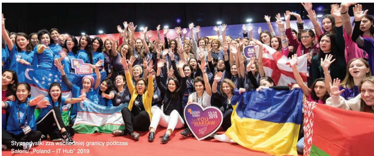
Warszawa, listopad 2019